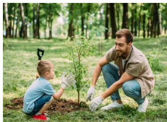
Plantar uma árvore

O que você pode fazer para ajudar a cuidar da natureza? Cada dia da semana vou dar uma dica para você ajudar a natureza, ok?!. Ah, não esqueça de enviar uma foto!