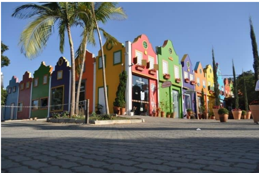
Holambra, São Paulo

https://quantocustaviajar.com/blog/cidades-brasil-parecem-europa/