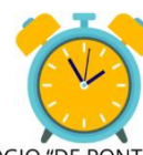
RELÓGIO "DE PONTEIRO"