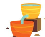
RELÓGIO DE ÁGUA