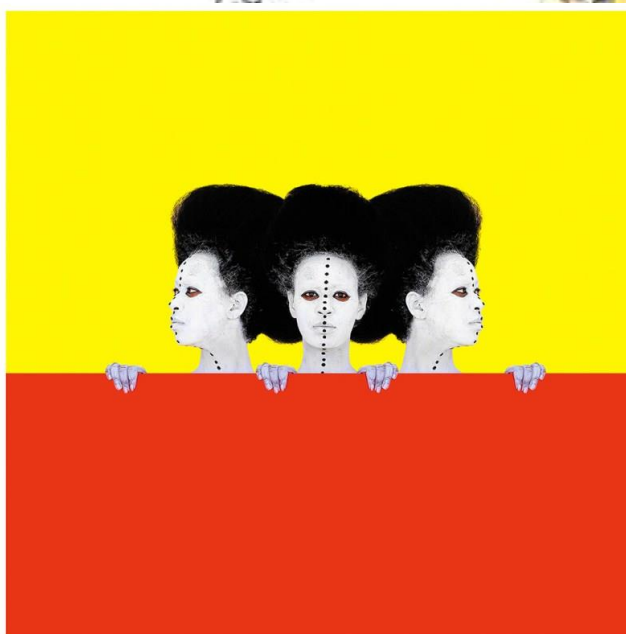
"Memory of Libya" Aida Muluneh

http://www.ifitshipitshere.com/aida-muluneh-the-world-is-9/