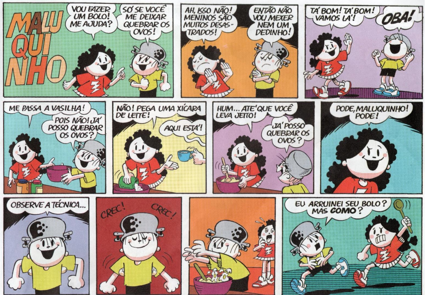
As melhores tiradas do Menino Maluquinho, Ziraldo. São Paulo, Editora Melhoramentos – 2000 (p. 26).

Leia atentamente a história em quadrinhos: