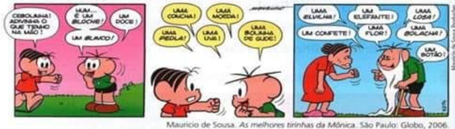
Maurício de Sousa. As melhores tirinhas da Mônica. São Paulo: Globo, 2006.

14) Observe a tirinha de Mauricio de Sousa.