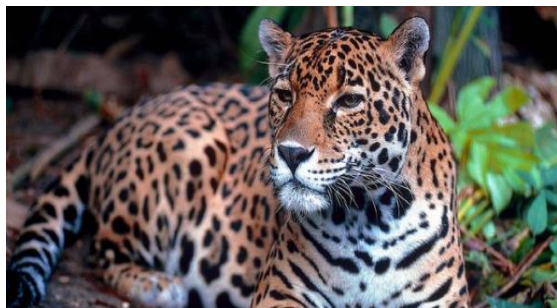
ONÇA - PINTADA

É O MAIOR FELINO DAS AMÉRICAS E TEM A MAIOR FORÇA NA MORDIDA: ISSO MESMO, MAIS QUE A DOS LEÕES OU TIGRES.