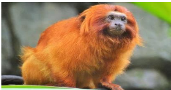
MICO - LEÃO - DOURADO

ESTE MACACO "RUIVO" FICOU FAMOSO AO TORNAR-SE UM SÍMBOLO DE ESPÉCIES BRASILEIRAS EM EXTINÇÃO.