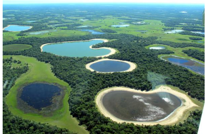
Acesso em setembro, 2020