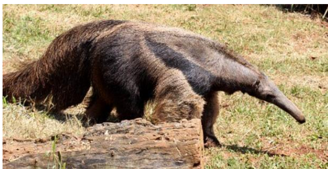
TAMANDUA - BANDEIRA

ESTE MACACO "RUIVO" FICOU FAMOSO AO TORNAR-SE UM SÍMBOLO DE ESPÉCIES BRASILEIRAS EM EXTINÇÃO.