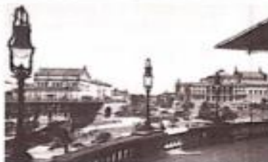
Vista parcial do Vale do Anhangabaú, na cidade de São Paulo (SP), em 1924.

Nessa época, o profissional responsável pela iluminação era chamado de acendedor de lâmpião.