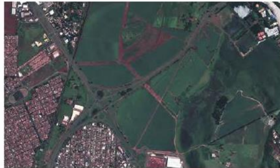
Parte do município de Ribeirão Preto, no estado de São Paulo. Foto de 2010.

Observe a imagem a seguir. Ela representa parte do município de Ribeirão Preto na visão vertical.