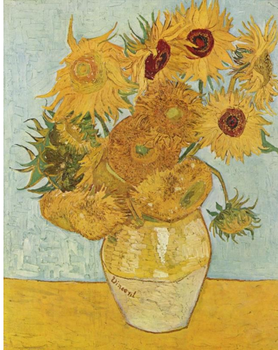
GIRASSÓIS, DE VINCENT VAN GOGH.